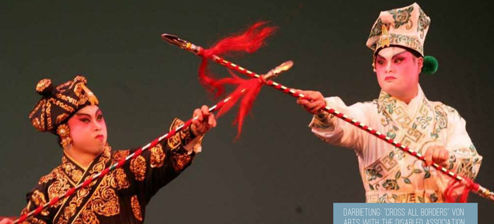
DARBIETUNG: "CROSS ALL BORDERS" VON ARTS WITH THE DISABLED ASSOCIATION HONG KONG